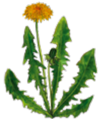
Illustration: U. Suckow