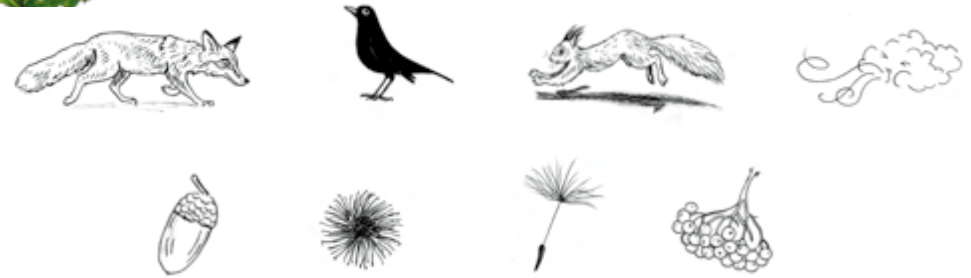
Illustration: U. Suckow

Welche dieser Samen werden durch den Wind verbreitet und welche durch Tiere? Ordne die Samen den Verbreitungswegen zu.