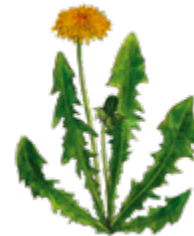
Illustration: U. Suckow