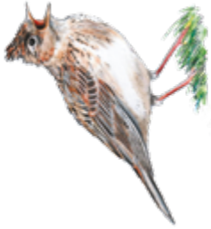
Illustration: U. Suckow

Finde in Büchern oder im Internet heraus, wie der Lebensraum der Feldlerche aussieht. Schnappe dir Stift und Zettel und zeichne den perfekten Lebensraum der Feldlerche. Hier ist Platz für deine Zeichnung.