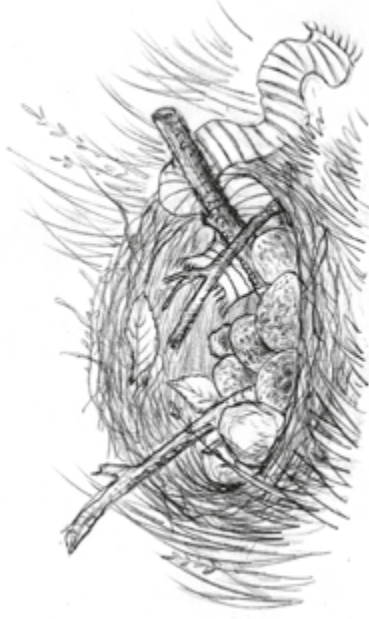
Illustration: U. Suckow

Seltsam: Die Feldlerche sitzt nicht auf ihren Eiern! Und noch seltsamer: In ihrem Nest finden sich einige Dinge, die da gar nicht hingehören. Findest du heraus welche?