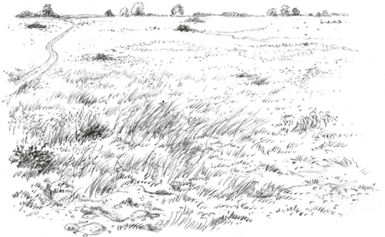
Illustration: U. Suckow

Frieda und andere Feldlerchen tummeln sich auf dem Feld. Findest du sie?