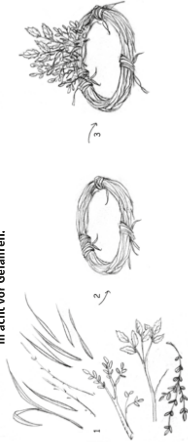
Illustration: U. Suckow

Die Feldlerche stellt bei Erregung ihre Haube auf. Bastel dir eine Haube, schmink dich wie eine Feldlerche und schlüpf mal in die Haut des Vogels. Flieg umher, erkunde die Umgebung mit Vogelaugen und nimm dich in acht vor Gefahren.