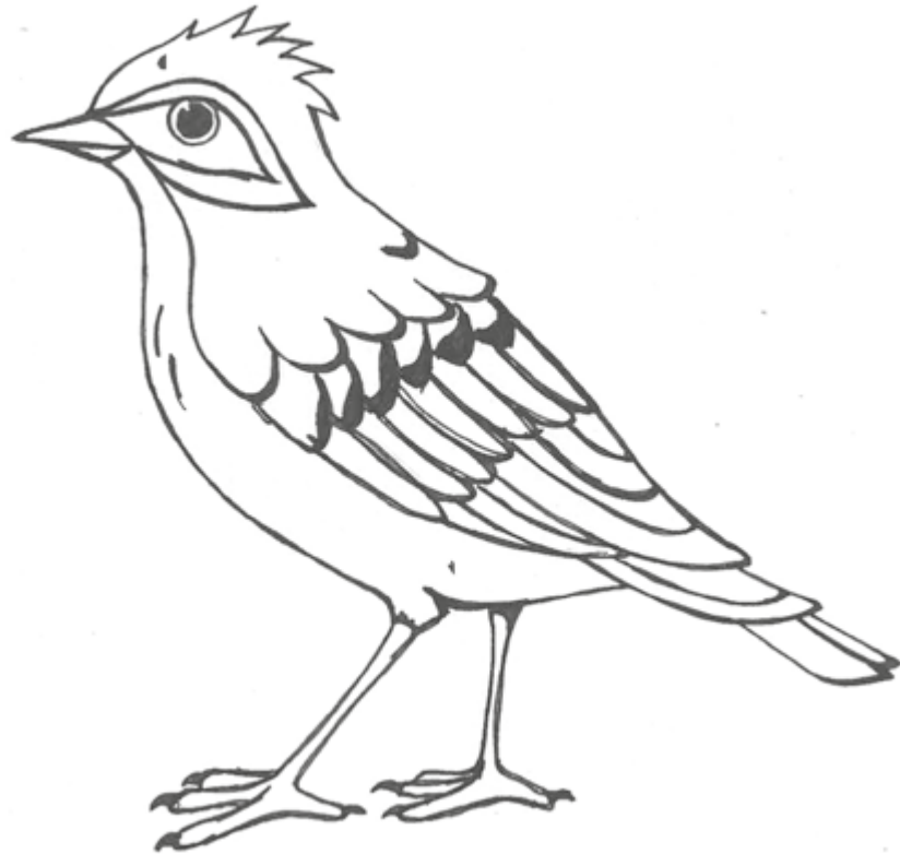
Illustration: U. Suckow

Die Feldlerche braucht Farbe. Hilf ihr und male sie aus.