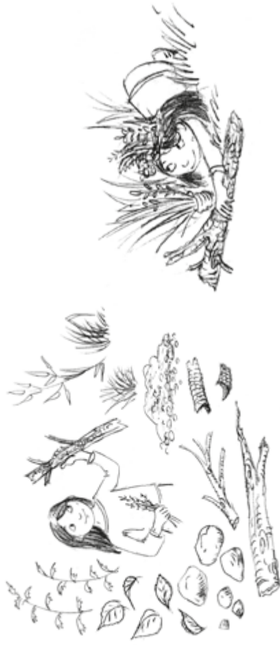
Illustration: U. Suckow

Für die Feldlerche ist Tarnung alles. Mache es der Feldlerche nach und tarne dich mit Naturmaterialien! Wer von euch kann draußen am besten „untertauchen“?