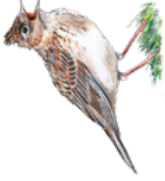
Illustration: U. Suckow

Wer und was lebt alles auf dem Acker? Schnappe dir Stift und Zettel und begib dich auf Forschertour. Male die Tiere auf und klebe deine schönsten Fundstücke hier ein und beschrifte sie.