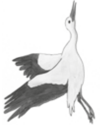
Illustration: U. Suckow