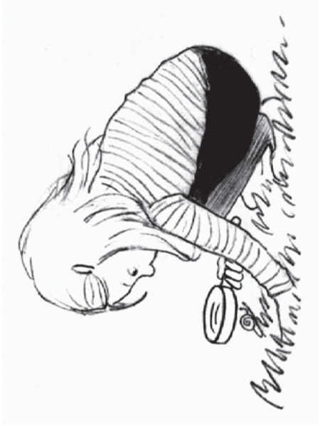
Illustration: U. Suckow

Wo kannst du draußen Schnecken und ihre Spuren entdecken? Schau genau hin!